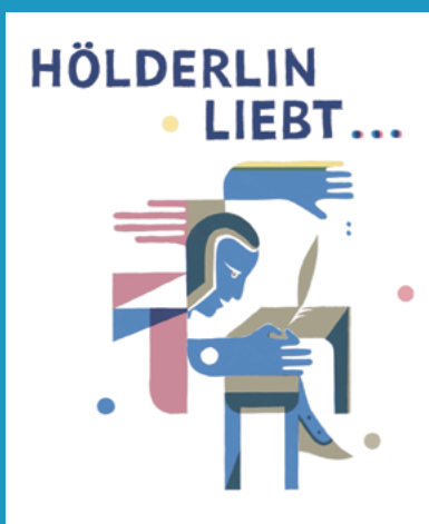
Plakat: Jette von Bodecker/ Museum Hölderlinturm

Friedrich Hölderlin ist einer der berühmtesten deutschen Dichter. Seine Gedichte sind allerdings schwer zu verstehen und dadurch vielen Menschen kaum zugänglich. Doch das geht auch anders, zeigt das Museum Hölderlinturm in Tübingen. In seiner Dauerausstellung geht es neue Wege, damit mehr Menschen die komplizierten Texte verstehen. Besucher*innen können die Literatur Hölderlins nicht nur lesen, sondern auch anhören oder fühlen.